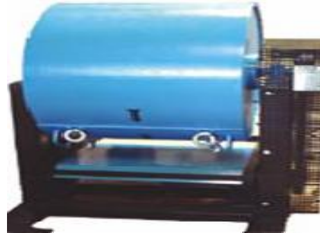
Figure : Appareil de Los Angeles.