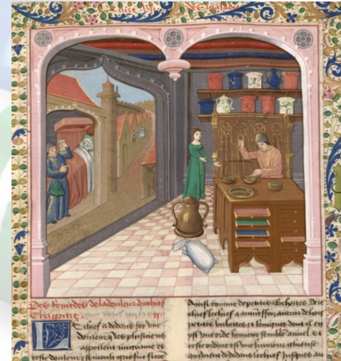
Apothicaire au moyen âge