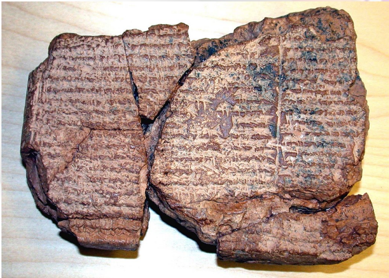
Tablette de rituels d'exorcismes contre les maux causés par les démons malfaisants