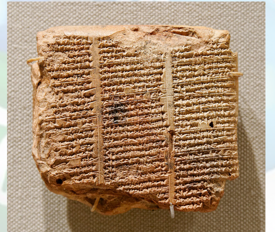
Tablette listant des pierres à usage prophylactique ou médicinal VI ème siècle Avant J-C