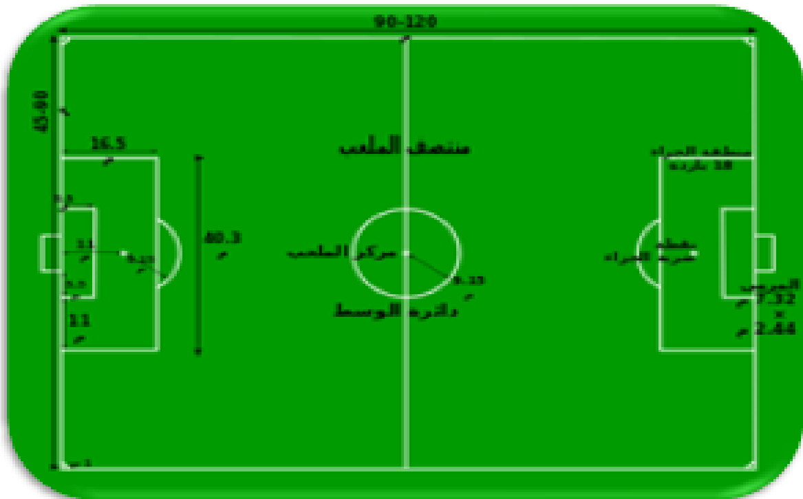
الشكل 1 - ملعب كرة القدم (مقاييس)

تعتبر كرة القدم الرياضة الأكثر شعبية وانتشاراً في العالم، و هي رياضة جماعية تلعب بين فريقين يتكون كل منهما من أحد عشر لاعبا (عشرة لاعبي ميدان زائد حارس مرمى)، و تلعب كرة القدم في ملعب مستطيل الشكل مع مرميين في جانبيه (الشكل رقم 1). الهدف من اللعبة هو إحراز الأهداف بركل الكرة داخل المرمى من أجل الفوز.