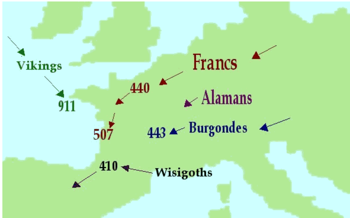
Les mouvements de population en Gaule du IVe au Xe siècle

NB: Les invasions vikings du IXe et Xe siècle n'ont donné que des parlers locaux et un peu de vocabulaire marin ( cingler, hauban, vague,... ).