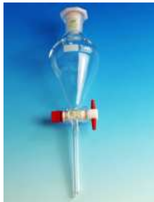
Ampoule à décanter