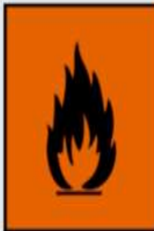
F - facilement inflammable