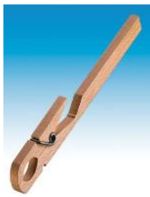
Pince en bois