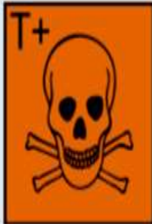
T+ - très toxique