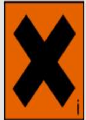
Xi - irritant