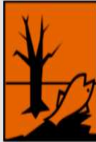
N - nocif à l'environnement