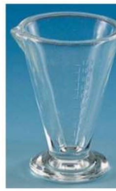
Verre à pied