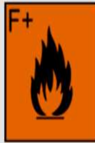
F+ - très facilement inflammable