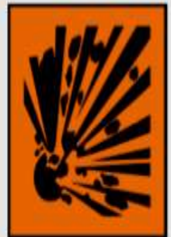
E - explosif