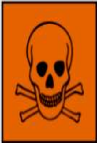
T - toxique