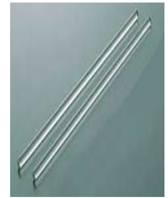
Agitateur en verre