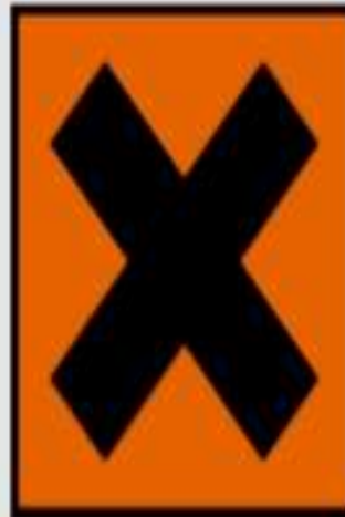
Xn - nocif