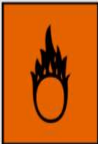
O - soutient la combustion