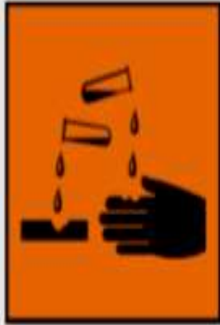
C - corrosif