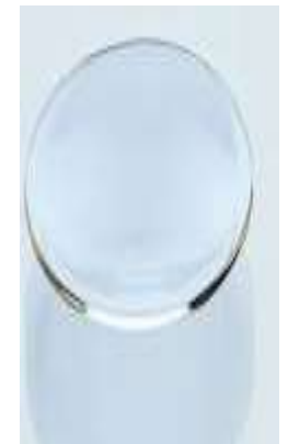
Verre de montre