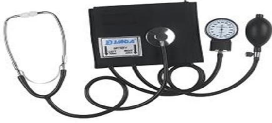
جهاز سفيجمومانوميتر لقياس ضغط الدم الشرياني.

هيلرستين HELLERSTIEN " من الضروري أن يعرف المرء الرياضي كيف يأخذ قياسات ضغط الدم وكيف يسجلها، و إن كان الأكثر أهمية هو أن يعرف كيف يفسر تلك القياسات و يستفيد من دلالاتها.