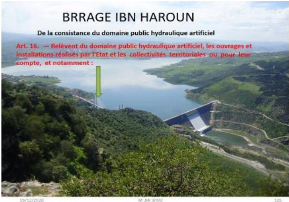
Figure I.2 : Présentation de la consistance du domaine public artificiel