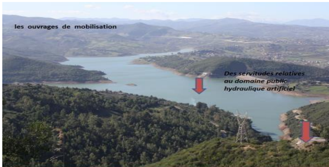
Figure I.3: Présentation des servitudes relatives au domaine public hydraulique artificiel